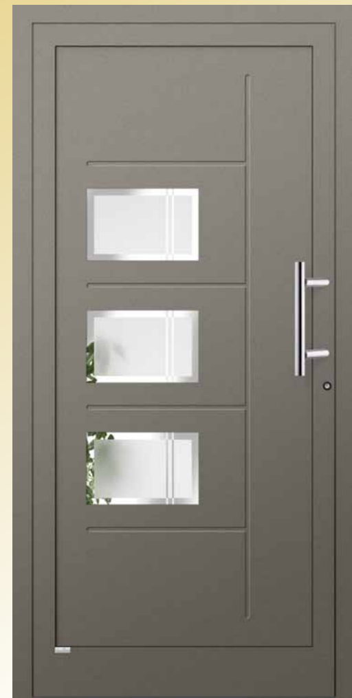
Opal gefräst, eingesetzt, PLF 79 graubraun feinstruktur Glas 3G 019 (Float teilmattiert), Griff AG 14 Edelstahl