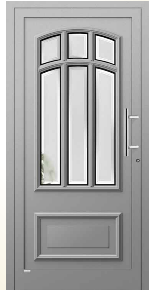
Jade eingesetzt , RAL 9007 graualuminium, Glas 6G 008 (Float teilmattiert), Griff AG 14 Edelstahl