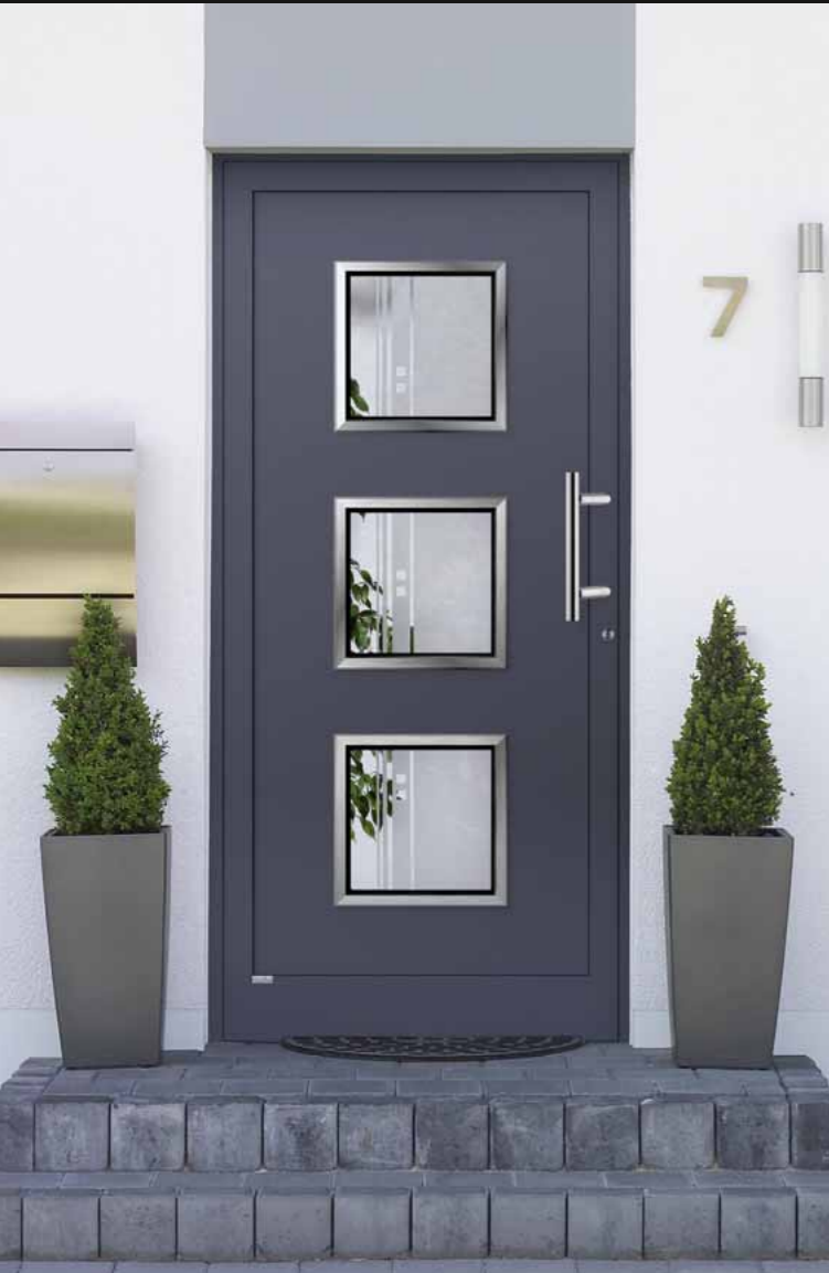
Aquamarin eingesetzt , RAL 7016 anthrazitgrau matt / Edelstahl-Optik außen, Glas 1G 008 (Float teilmattiert) Griff AG 14 Edelstahl