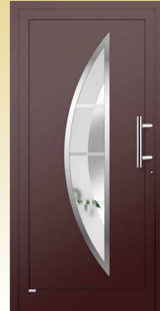
Granat eingesetzt , RAL 3007 matt / Edelstahl-Optik außen Glas 2G 005 (Float teilmattiert), Griff AG 14 Edelstahl