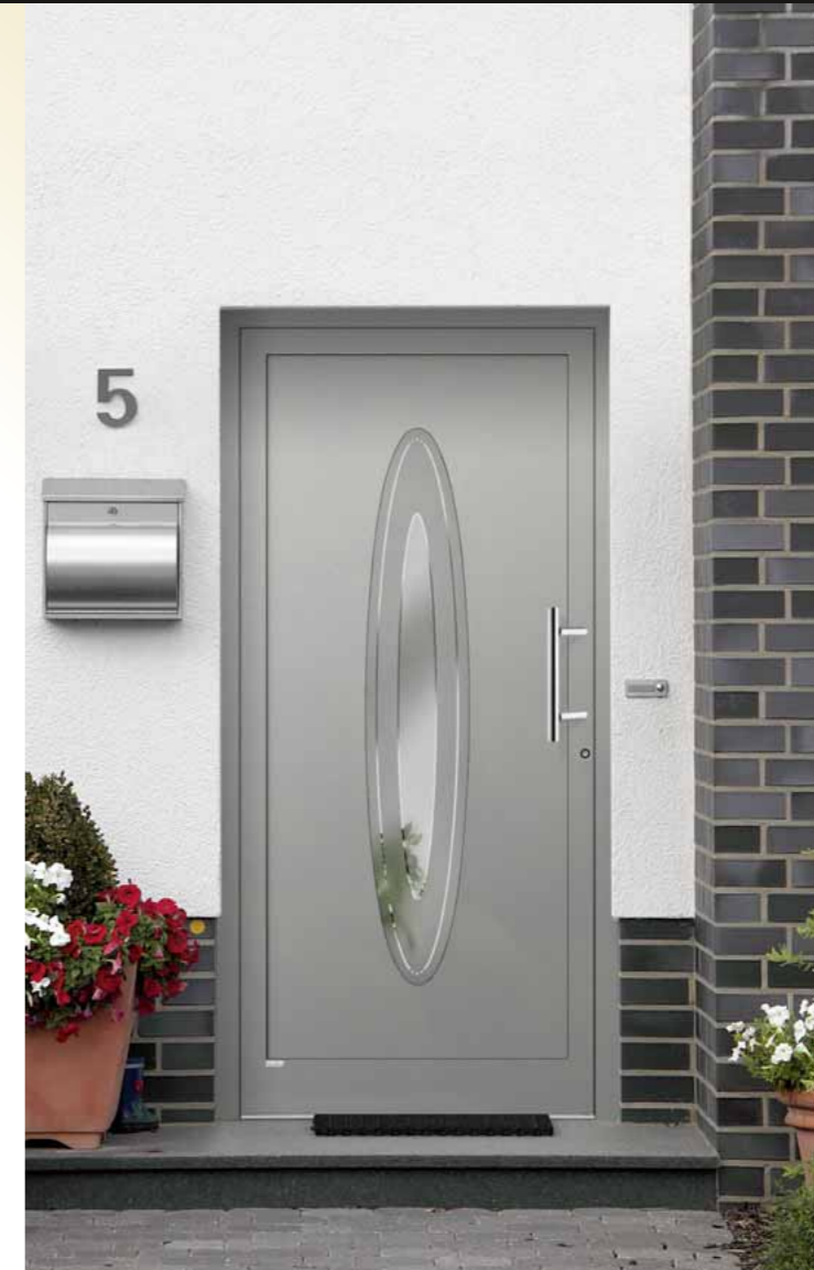
Turmalin eingesetzt , RAL 9007 graualuminium Glas 3G 021 (Float teilmattiert), Griff AG 14 Edelstahl