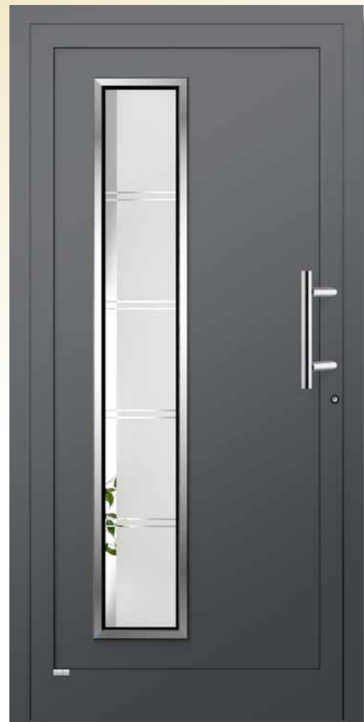
Rubin eingesetzt, RAL 7016 anthrazitgrau matt / Edelstahl-Optik außen, Glas 1G 014 (Float teilmattiert) Griff AG 14 Edelstahl