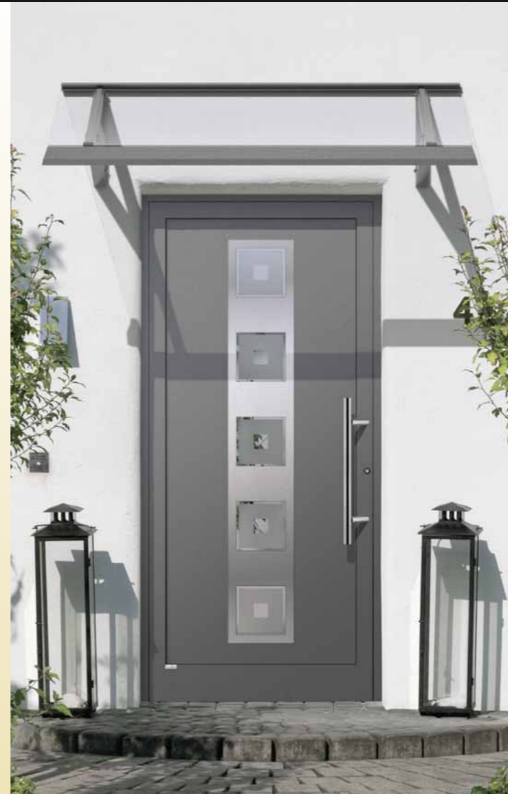
Smaragd eingesetzt , DB 703 dunkelgrau matt / Edelstahl-Optik außen, Glas 2G 002 (Float teilmattiert) Griff AG 19 Edelstahl 600 mm