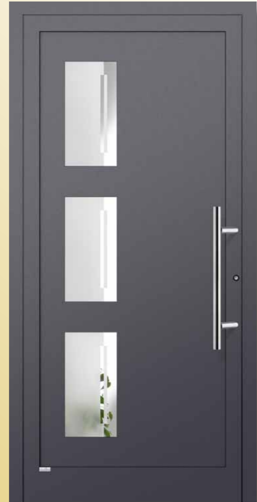
Topas eingesetzt , PLF 95 schwarzgrau feinstruktur Glas 3G 018 (Float teilmattiert) Griff AG 19 Edelstahl 600 mm